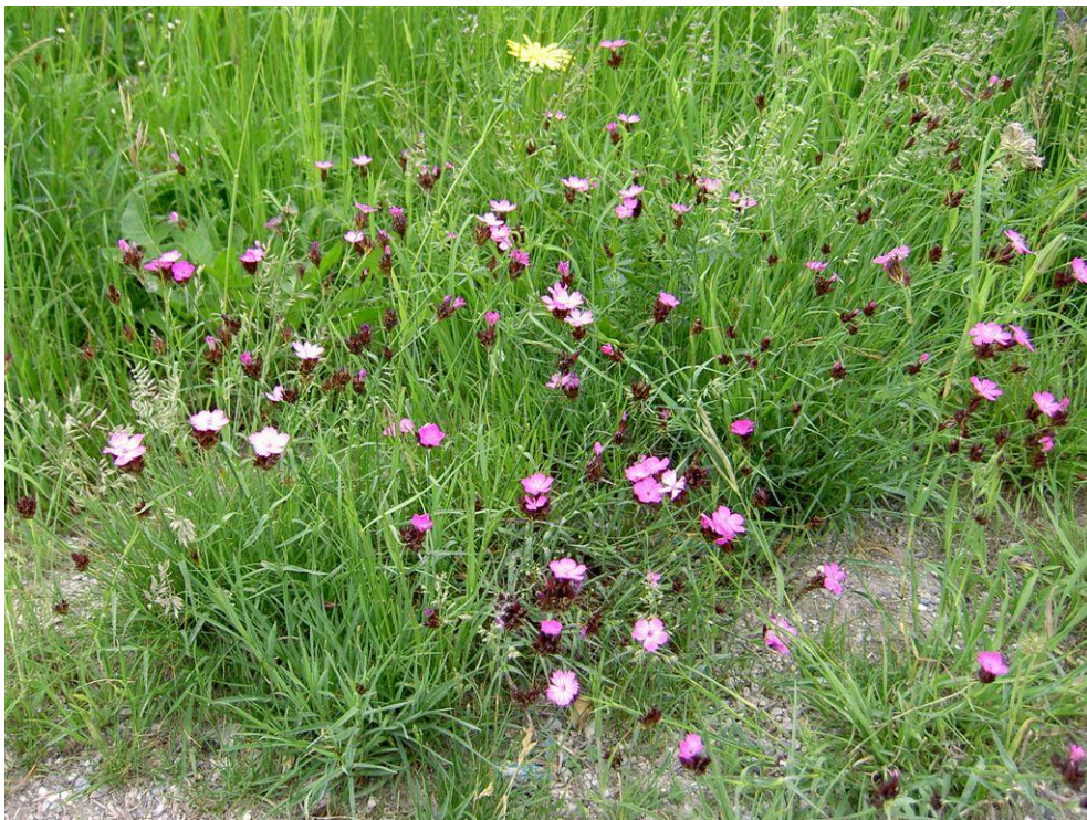
Berm met karthuiser anjer