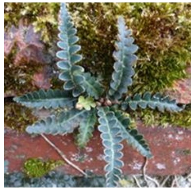
Muur met schubvaren